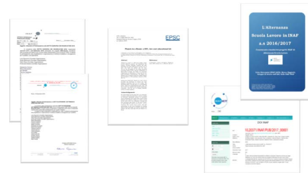
Attività «in CV»