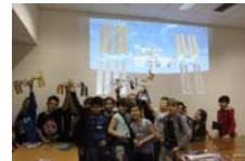
Laboratori didattici per i più piccoli

Laboratori, esperimenti e progetti da concordare con gli insegnanti