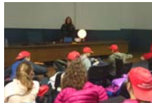
Lezioni con Pianeti in una Stanza