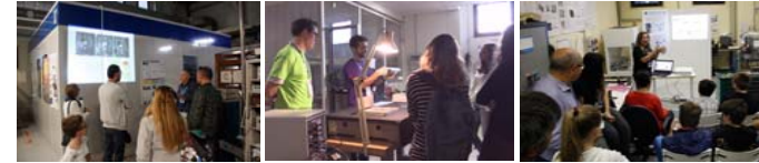
Camera a plasma