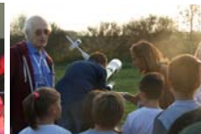
Osservazioni al telescopio